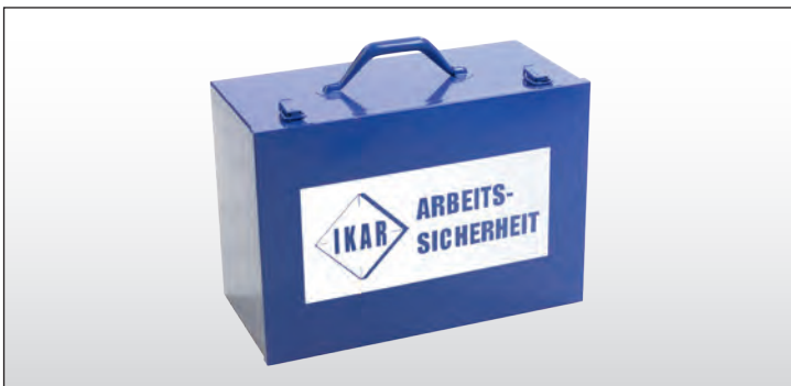
Transportkoffer Carrying case